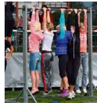
Piedalies novada Sporta spēlēs 2013! 4. lpp.