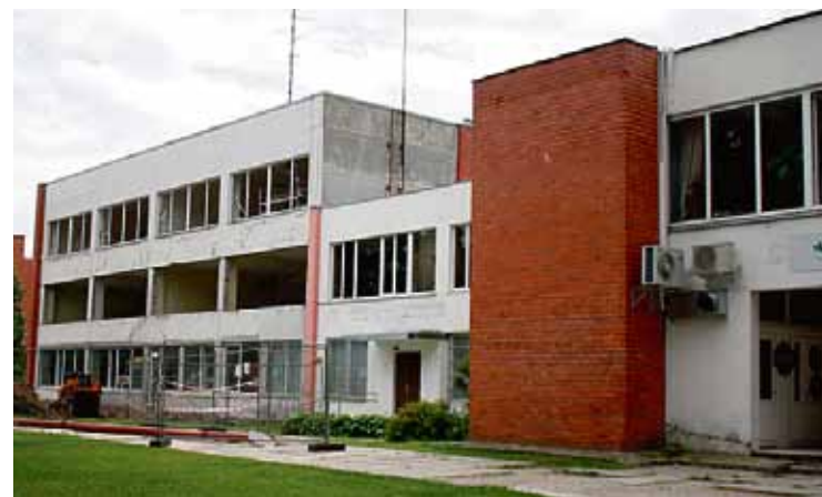
Sākusies nedzīvojamās ēkas rekonstrukcija par Babītes mūzikas skolu un bibliotēku (Jūrmalas ielā 14A)

2.12. SIA "Būves un būvstēmas" par būvuzraudzību "Nedzīvojamās ēkas rekonstrukcijas par Babītes mūzikas skolu un bibliotēku nekustamajā īpašumā Jūrmalas iela 14A, Piņķi, Babītes novads būvdarbiem", līgumcena Ls 5893, termiņš – 16.06.2014.;