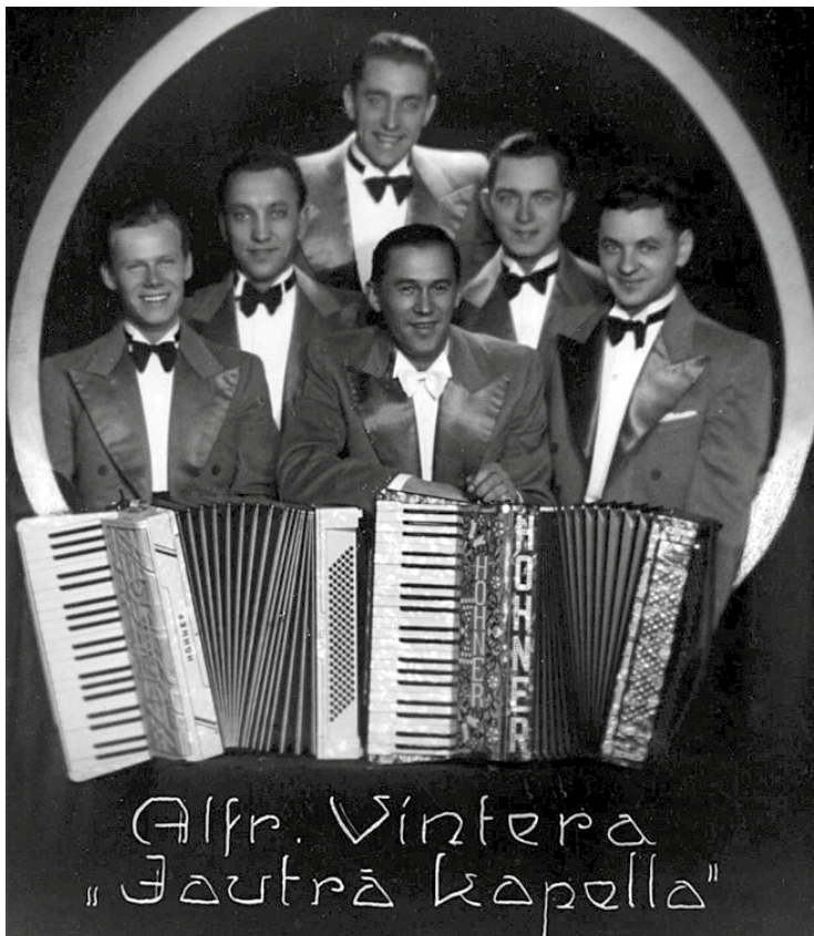
Idejas autors P. Grēniņš lūdz palīdzību attēlā redzamo personu atpazīšanā.

Novada pagastos sabiedrisko organizāciju nav bijis daudz. Netālais Džūkstes pagasts var lepoties ar 22 sabiedriskajām organizācijām vienlaikus un vismaz 17 valsts mēroga rakstniekiem, zinātniekiem, kultūras darbiniekiem, kā arī aptuveni 30 vietējas nozīmes censoņiem. No Babītes novada cēlušies vai te darbojušies pavisam nēcīgs daudzums ārpus pagasta pazīstamu cilvēku. Tuvā Rīgas pilsēta un Jūrmala noēnojušas vietējās aktivitātes. Kāpēc celt dižus tautas namus, organizēt spirta brūzus, veidot teātra vai saviesīgās biedrības, ja ir iespēja izmantot